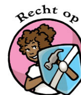
Recht op Bescherming tegen kinderarbeid