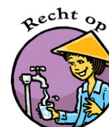
Recht op Veilig water