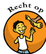
Recht op Zorg voor gehandicapte kinderen

Op 20 november van ieder jaar wordt stilgestaan bij het 'Internationaal Verdrag inzake de Rechten van het Kind'. SOL is bezig met het schrijven van een speciale lesbrieven voor de groepen 6-8. In deze lesbrieven wordt in het bijzonder aandacht geschonken aan artikel 14 (vrijheid van gedachten, geweten en godsdienst) en artikel 30 (vrijheid van kinderen uit minderheidsgroepen om hun eigen cultuur, godsdienst en taal te gebruiken). Kinderen hebben het recht zich te onderscheiden maar ook om zich aan te passen als ze dat willen. Over deze kwestie wil de lesbrieven het gesprek tussen de kinderen stimuleren. Zodra de lesbrieven af is, vindt u deze op onze website bij 'Actueel'.