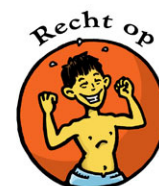
Recht op Een gezond leven