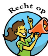
Recht op Een eigen mening