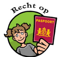
Recht op Een naam en nationaliteit