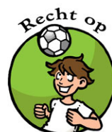
Recht op Sport en ontspanning