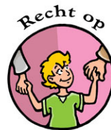
Recht op Familie