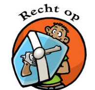
Recht op Bescherming bij een oorlog