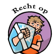
Recht op Bescherming tegen mishandeling en geweld