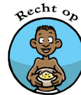
Recht op Voedsel