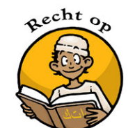
Recht op Onderwijs