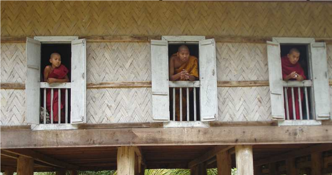
het klooster van Cha

In het Boeddhisme is vrijgevigheid belangrijk. De mensen geven eten aan de monniken en de monniken op hun beurt vertellen over de leer van Boeddha. Dit verhaal over Cha is aanleiding voor verdere verdieping in het Boeddhisme in midden- en bovenbouw. Ook andere religies kunnen aan bod komen via opdrachten waar de leerlingen informatie kunnen zoeken over religies.